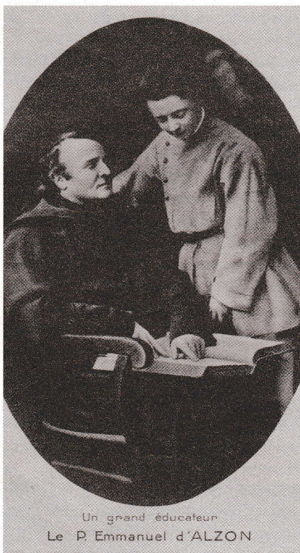
Un grand éducateur Le P. Emmanuel d'ALZON

Dans Le Pèlerin des débuts, le Père d'Alzon publia un assez grand nombre d'articles, des homélies du dimanche, des vies de saints et des récits de voyage.