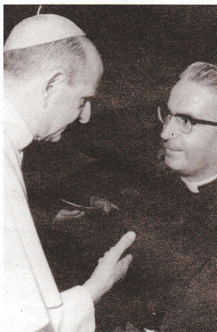
À Rome, avec le pape Paul VI, le 6 juin 1973.

temps, à la constitution, en 1978, d'une unique province assomptionniste de France.